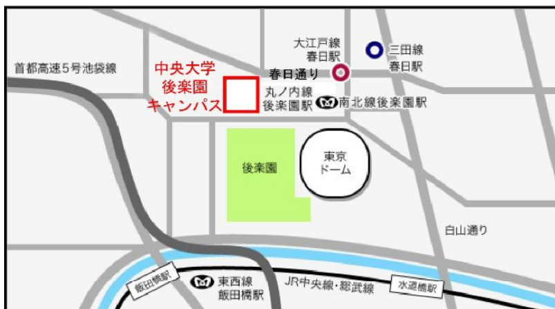
学会事務局が所在する「中央大学後楽園キャンパス」位置